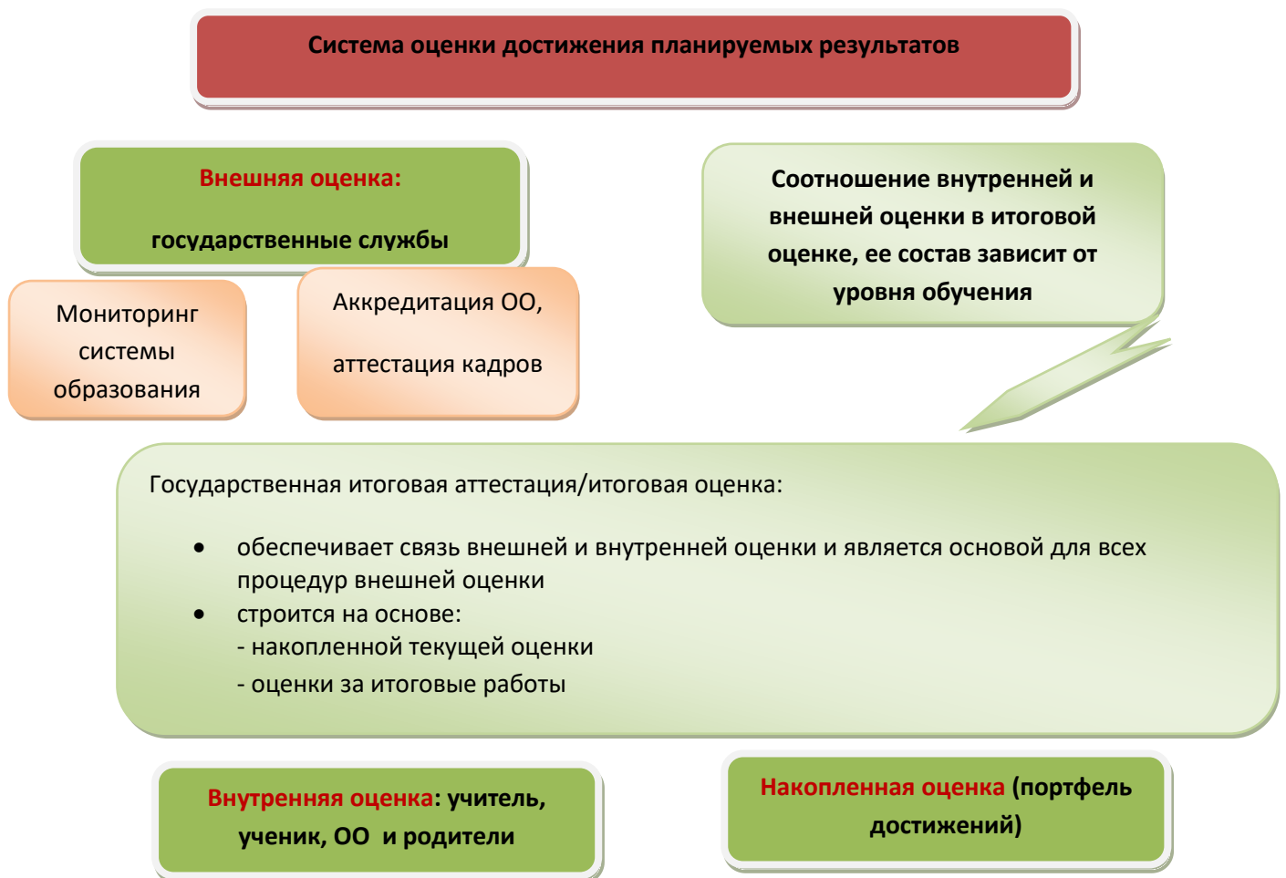
Рис. 2. Система оценки достижения планируемых результатов

В соответствии с ФГОС ООО основным объектом системы оценки результатов образования, её содержательной и критериальной базой выступают требования Стандарта , которые конкретизируются в планируемых результатах освоения обучающимися основной образовательной программы основного общего образования.