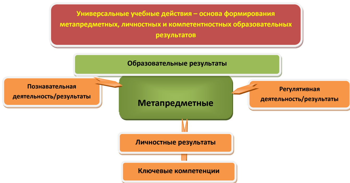
Рис. 3. Система оценки образовательных результатов

Система оценки предусматривает уровневый подход к представлению планируемых результатов и инструментарию для оценки их достижения. Согласно этому подходу за точку отсчёта принимается не «идеальный образец», отсчитывая от которого «методом вычитания» и фиксируя допущенные ошибки и недочёты, формируется сегодня оценка ученика, а необходимый для продолжения образования и реально достигаемый большинством обучающихся опорный уровень образовательных достижений. Достижение этого опорного уровня интерпретируется как безусловный учебный успех ребёнка, как исполнение им требований Стандарта. А оценка индивидуальных образовательных достижений ведётся «методом сложения», при котором фиксируется достижение опорного уровня и его превышение. Это позволяет поощрять продвижения учащихся, выстраивать индивидуальные траектории движения с учётом зоны ближайшего развития.